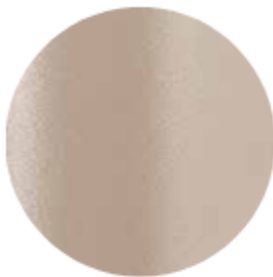
SA200E Sand / Sabbia

Sämtliche Nebenleistungen, Lieferkosten, Montageleistungen, Befestigungsmaterialien, Werkzeuge sowie An- und Abfahrten sind in die Einheitspreise einzukalkulieren.