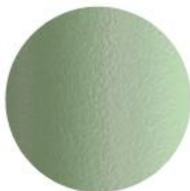
VE100E Sage green / Verde salvia